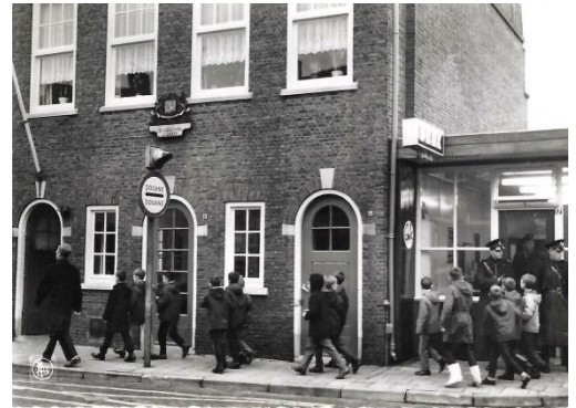
De kinderen steken de grens over in Putte

Het was een lezeres uit Antwerpen die ons aanraadde naar Heide-Kalmthout te gaan. Daar, in klassen midden in het bos, verblijven de leerlingen van de lagere scholen uit de metropool. De formule is niet nieuw: al jarenlang verblijven jongens en meisjes, vergezeld door hun meesters en juffen, van maandag tot vrijdag in het prachtige domein aan de rand van een uitgestrekt reservaat, vlak bij de Nederlandse grens. Elke school komt om de beurt aan bod. Dit verblijf biedt de kans om veel te leren door de oren en ogen wijd open te sperren. Want wanneer het onder toezicht staat en didactisch georganiseerd is, blijft "spijbelen" (buiten school zijn) de beste methode om zaken te onthouden. De pedagoog van de kleine stadsbewoners beschikt vaak alleen nog over plaatjes en boeken om het onderwijs te illustreren. Vandaar het documentatiewerk dat van scholieren wordt verlangd zodra het over natuurlessen gaat. Paarden, koeien, boerderijen, bomen en de bewoners van het platteland zijn ver weg van de grote steden. Om ze te leren kennen, moet men ze opzoeken, ze zien leven in hun omgeving en, zoals elk nieuwsgierig mens, een eigen dossier aanleggen. Een dossier dat weliswaar door de onderwijzer wordt opgelegd, maar dat door elk kind naar eigen persoonlijkheid wordt ingevuld. Dit is, in het kort, wat de directie van het Openbaar Onderwijs van Antwerpen met succes heeft gerealiseerd.